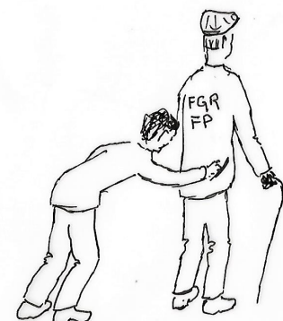
Premier ministre glanant quelques sous pour boucler son budget.

Ce pourrait être un marronnier 1 dans tous les médias. Depuis des années, les gouvernements et les économistes remettent le thème sur la table : pour mettre à contribution les retraités, supprimons l'abattement fiscal de 10 % comme le suggère la ministre du Travail, Astrid Panosyan-Bouvet.