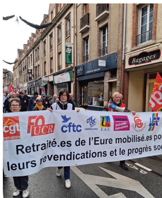
Participation de la FGR-FP départementale à une manif !

Réunion départementale des Adhérents de la FRG-FP Cette année encore elle se tiendra à : Conches au pôle culturel, à 10h le vendredi 13 mars