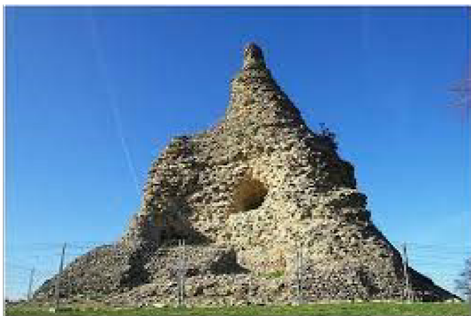
PIERRE DE COUHARD