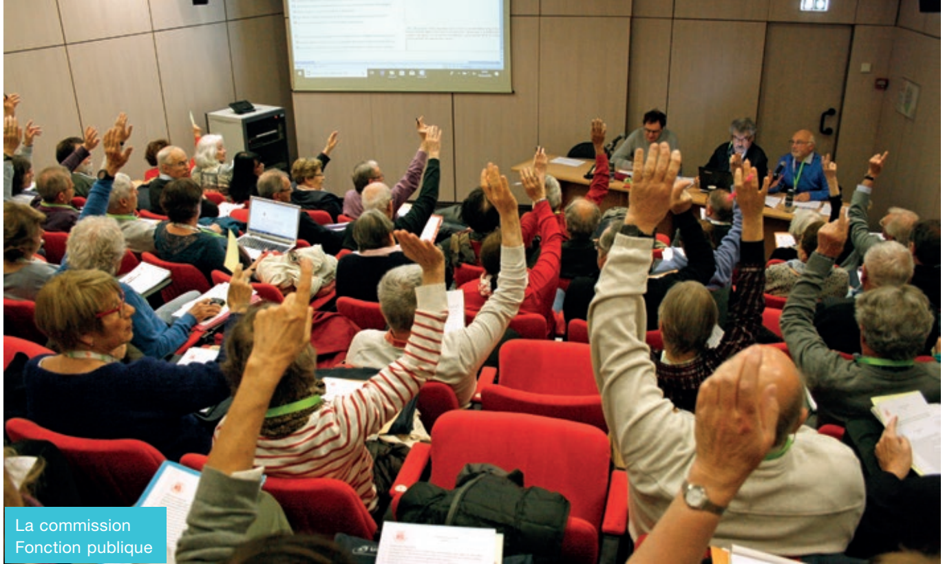
La commission Fonction publique

La pension du retraité n'est pas une allocation sociale, elle est un droit lié à un statut professionnel et aux cotisations versées. C'est pourquoi la FGR-FP revendique une évolution des pensions indexée sur celle des salaires et elle s'oppose à la mise en place d'un système à points qui ferait, plus encore, de la pension une variable d'ajustement.