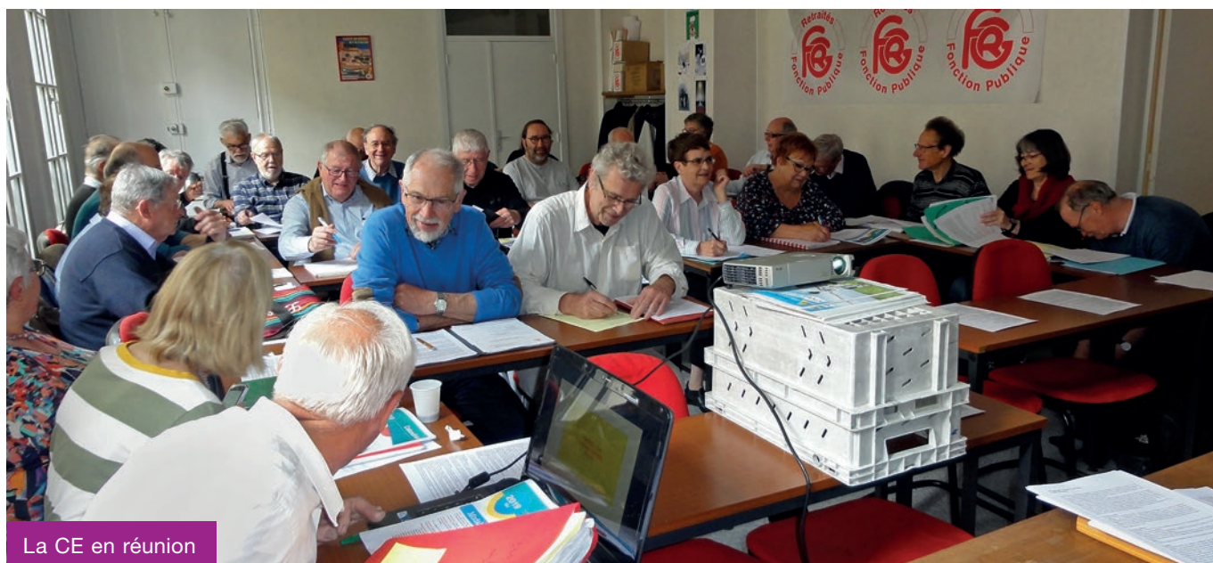
La CE en réunion

La Commission exécutive nationale s'est réunie les 21 et 22 mai 2019. Outre l'adoption à l'unanimité de la motion qui est le fruit des débats de ces deux journées, elle a procédé à l'actualisation du règlement intérieur et a réparti ses membres dans les groupes de travail : place du retraité, fonction publique, protection sociale et fiscalité.