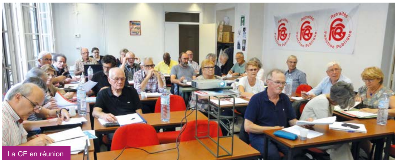
La CE en réunion

La Commission exécutive nationale s'est réunie les 17 et 18 septembre 2019. Les dossiers réforme des retraites, Fonction publique, fiscalité, protection sociale et urgence climatique ont été largement débattus. La motion, adoptée à l'unanimité, appelle à faire du 8 octobre une journée de mobilisations dans tous les départements.