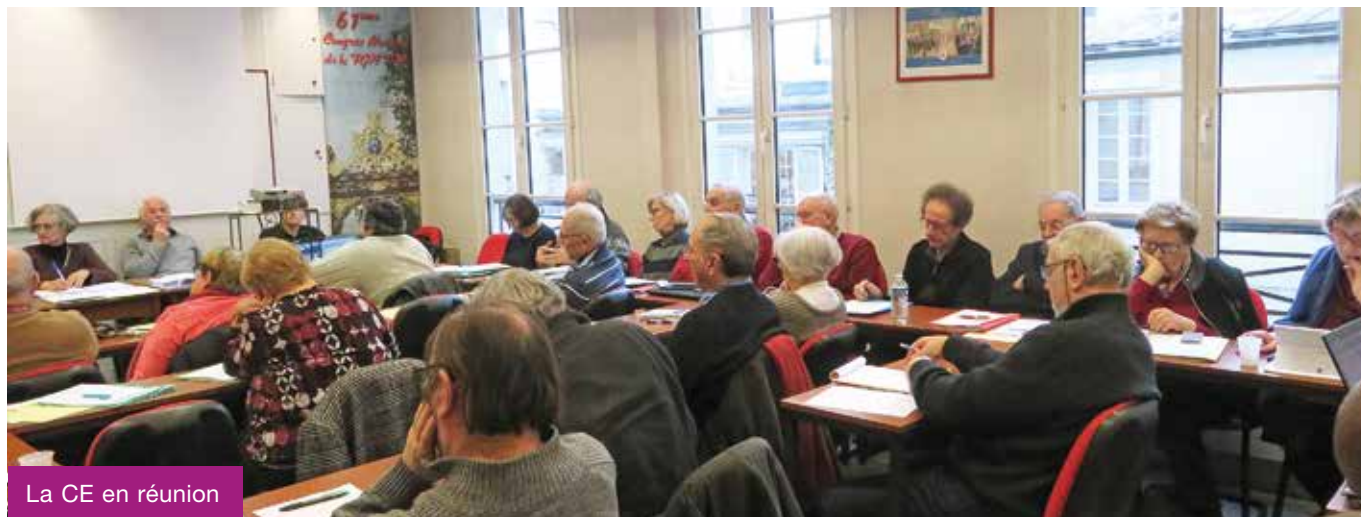
La CE en réunion